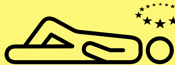
Mynd yn anymwybodol